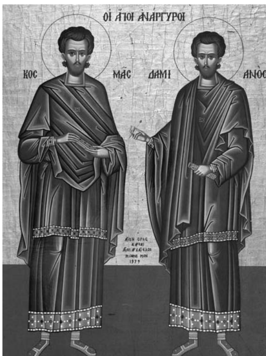
Santos Cosme y Damián

SAN NICOLÁS protector de los viajeros, (en esta ocasión de los emigrantes)