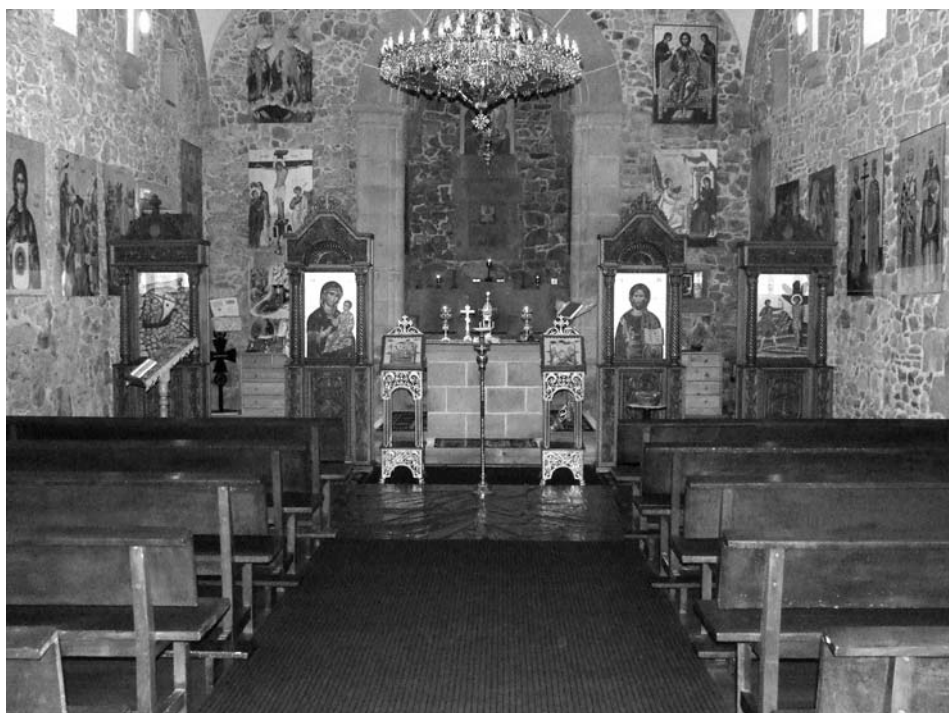
Interior de la ermita (20102011)

Con fecha 7 de junio de 2010, el obispo de San Sebastián D. José Ignacio Munilla y D. Timoteo Lauran obispo de la Iglesia Ortodoxa de Rumania para España y Portugal, firmaron el pacto de cesión de uso de la ermita de Uba.