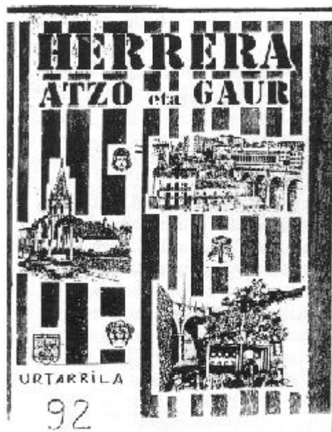
Portada de la revista "Herrera atzo eta gaur" (1992), depositada en la Colección Local

Nos gustaría que el ejemplo del AUZOTEGI de Herrera sirviera para animar a tod@s aquell@s que cuenten con material similar (fotografías, artículos de prensa, revistas locales, cualquier documentación sobre Altza...) a ponerse en contacto con nosotros, pues es labor de todos los altzataras la recuperación, custodia y divulgación de nuestro patrimonio gráfico y documental.*