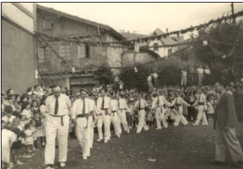
Intxaurreondo, Fiestas de Sta. Cruz, año 1957-59 aprox. (Josean San Roman)