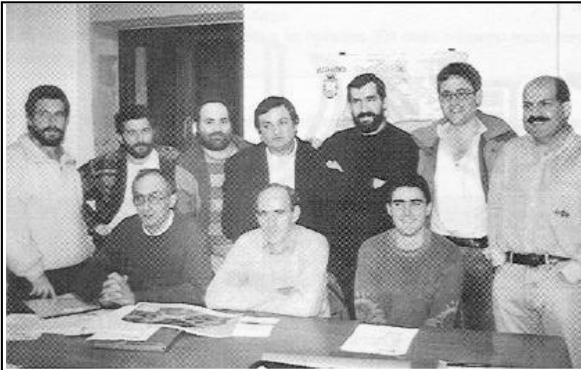
ALTZAKO HISTORIA MINTEGIAko partaideak