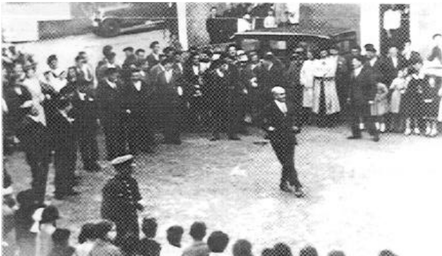
Aurreku de la Corporación altzatarra en la Plaza de San Marcial (año 1931).

Cuando nace un nuevo ser, sus creadores depositan en él toda su ilusión. Nosotr@s también confiamos en ver a Estibaus crecer, desarrollarse y responder a las expectativas que hemos puesto en él. Estibaus es un nombre viejo para un proyecto nuevo que arranca con este número.*