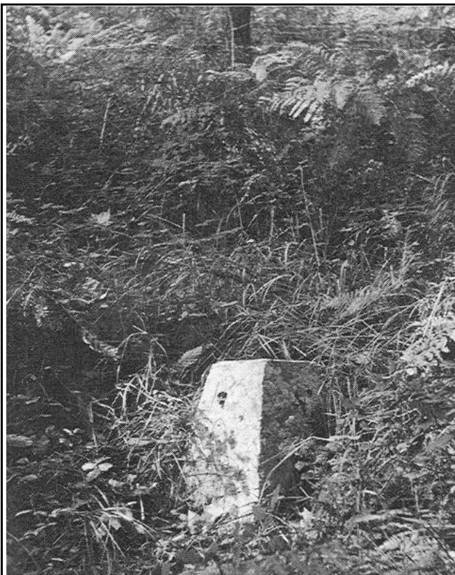
Mojón de IRUMUGARRIETA, lugar donde convergen los municipios de Astigarraga- Rentería-Altza (hoy San Sebastián). (Desaparecido bajo el Vertedero de San Marcos)

Con estas líneas tratamos de animaros a compartir con nosotros alguna de estas actividades.*