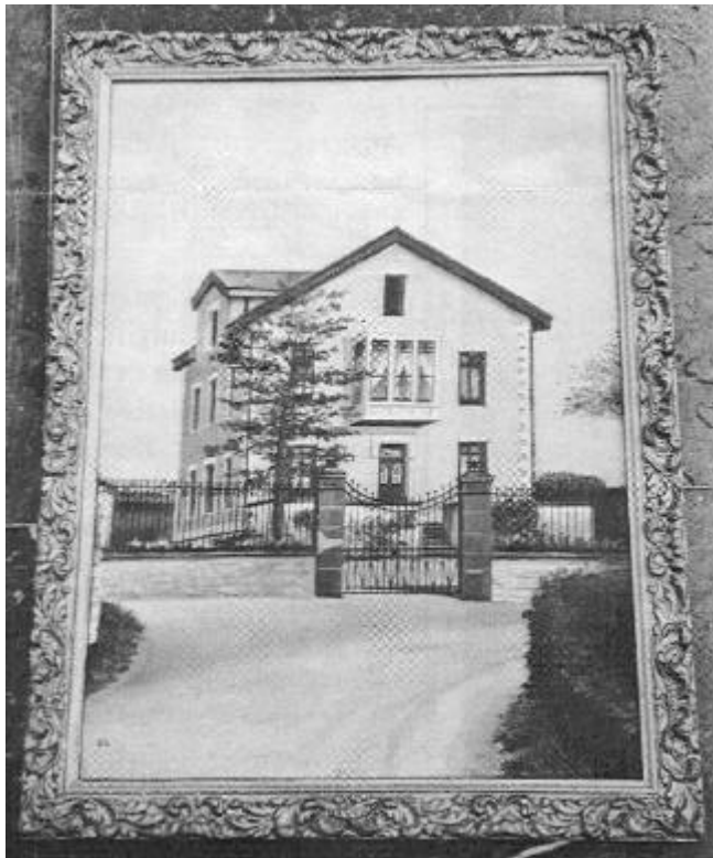
La Villa Casares se encontraba a la derecha de la entrada de lo que hoy es el barrio de Arri-Berri.