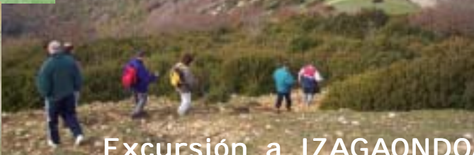
Excursión a IZAGAONDOA (06-11-04)