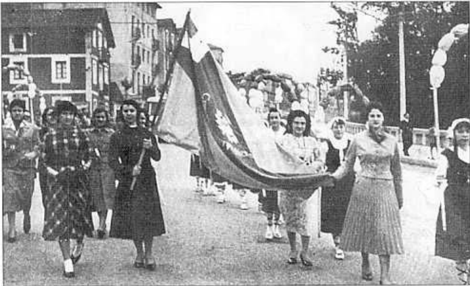
Foto inferior: