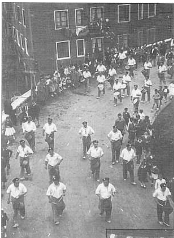
Año 1957. Subiendo por la carretera a Altza. Se solía dar la vuelta en Casa Landa y algunas veces en Itziartxo.