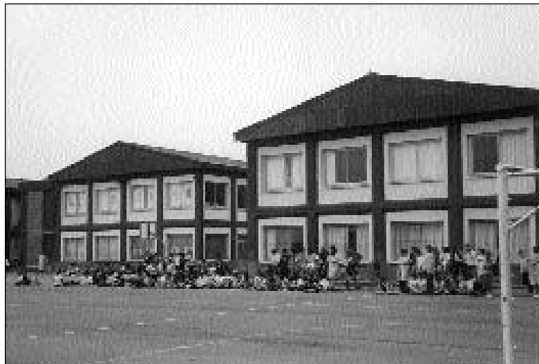
Fachada del nuevo SAN LUIS-LA SALLE. Fiesta colegial deportiva con motivo de la festividad de San Juan Bautista de La Salle, 15 de Mayo