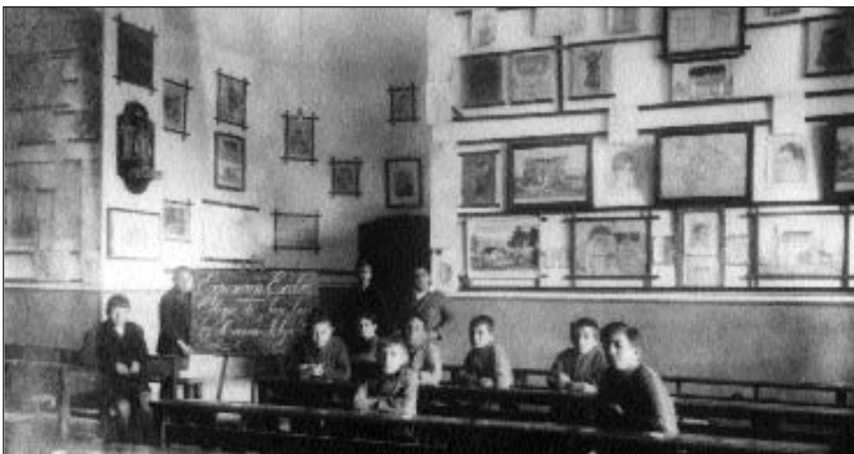
En la pizarra aparece escrito: "Exposición Escolar. Colegio de San Luis. Herrera-Alza"