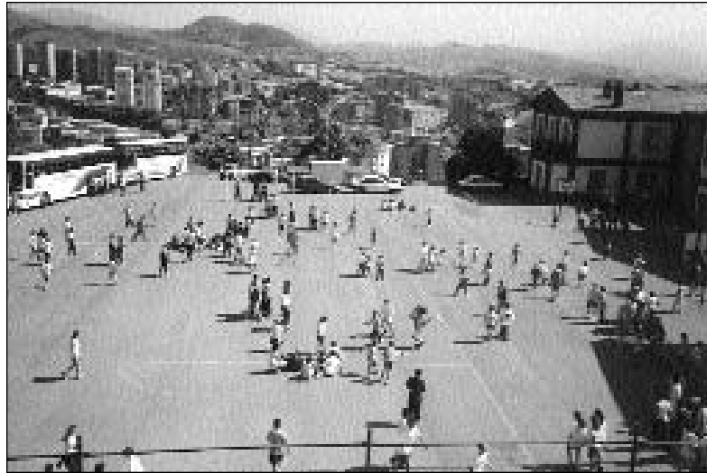
Vista general del patio de juego de SAN LUIS-LA SALLE. Autobuses de UNITRAVEL y DÍEZ que realizan el servicio de Transporte Escolar. Al fondo vista casi aérea de Herrera, Larratxo y Altza.