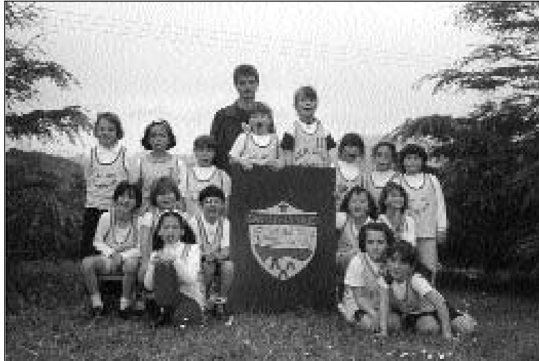
Equipo de Baloncesto de alumnas de SAN LUIS-LA SALLE.