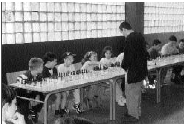
Concurso de ajedrez de un grupo de niños contra un experto con motivo de las fiestas de La Salle. Mayo 1998.