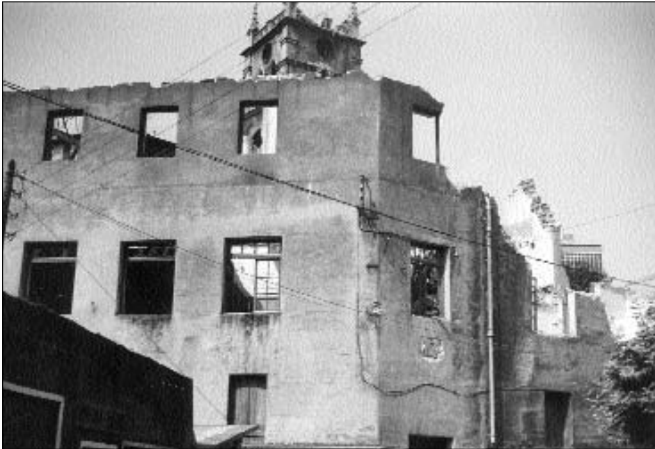
1972. Derribo de la Parroquia SAN LUIS GONZAGA de Herrera y del Colegio SAN LUIS-LA SALLE de Herrera.