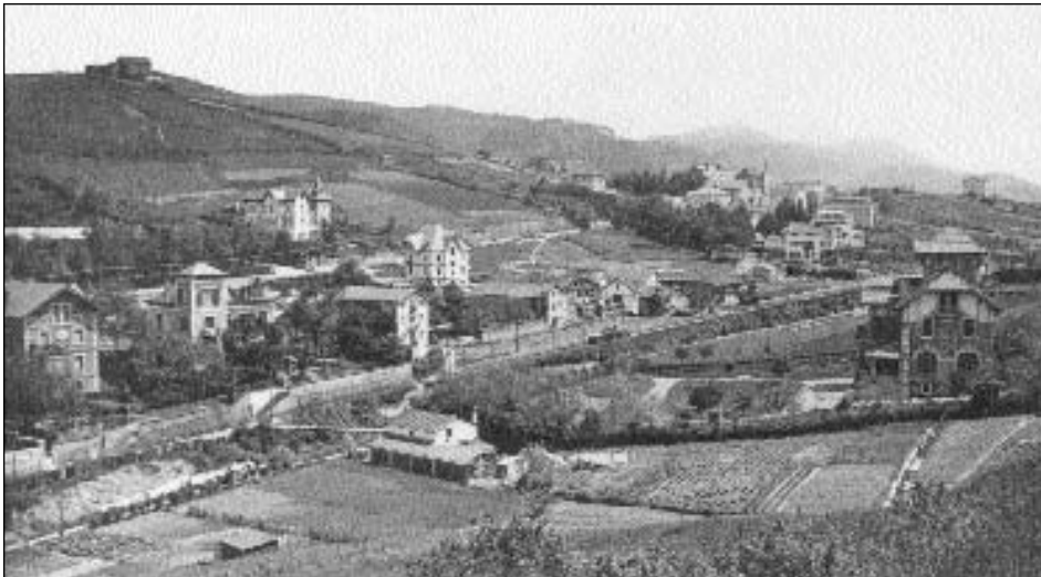
Alto de Miracruz. A la derecha casa Atsedenetxe, y unos metros hacia abajo, se puede observar la casa de Nicolás Garmendia; al fondo a la izquierda el colegio La Asunción y la villa Iruña; un poco más a la izquierda el monte Ulia y en la parte superior el caserío Labeas.

Con esta retrospectiva fotográfica queremos recordar a vecinos y vecinas del barrio Miracruz que en su día tuvieron relevancia social y política en la vida de Altza. Sabemos que aquí no están todos, pero en un futuro cercano esperamos ampliar esta fototeca y poco a poco llegar a reunir la más amplia representación de todas las personas que han contribuido en la realización de lo que Altza e Intxaurreondo son en la actualidad.