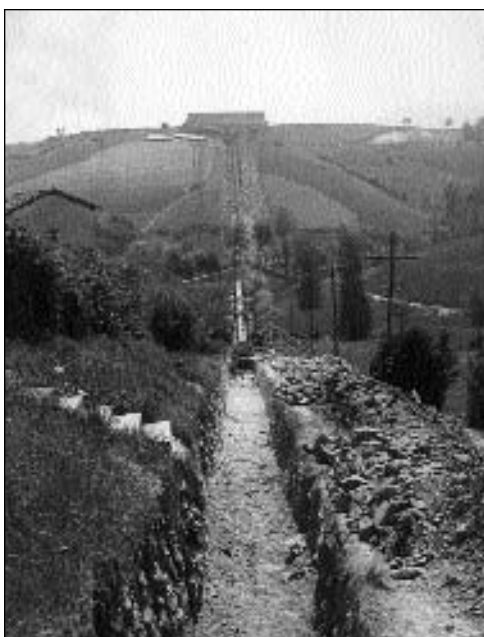
Traída de aguas de la presa de Añarbe. Al fondo, en el campo de fútbol de Herrera, se ve la arqueta que se dirige al depósito de Mons, siempre en distrito altzatarra. Obra empezada en Mayo de 1960 y terminada en el 1962.