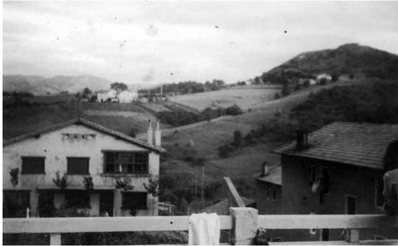
Vista parcial de Molinao. En primer plano Villa Bat y a la derecha Villa Juanita. Al fondo, el caserío Iparragirre y a la derecha el fuerte San Marcos y los caseríos Miramar y Txipres. En aquel tiempo residían en Villa Bat las familias de Nicolás Fernández, Pedro Tolosa, Pablo Fernández y Pepe Moranchel. Hacia 1960