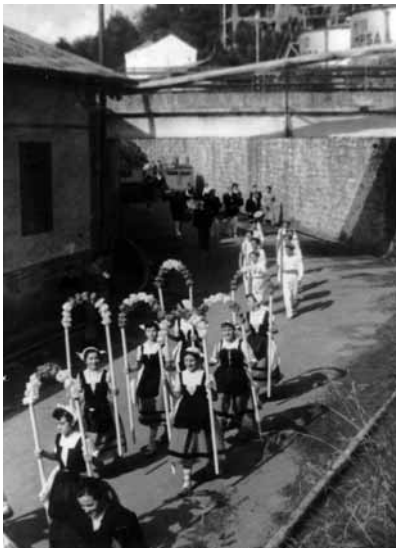
Grupo de Danzas Alkartasuna en las fiestas patronales de Molinao, el 8 de agosto de 1968.