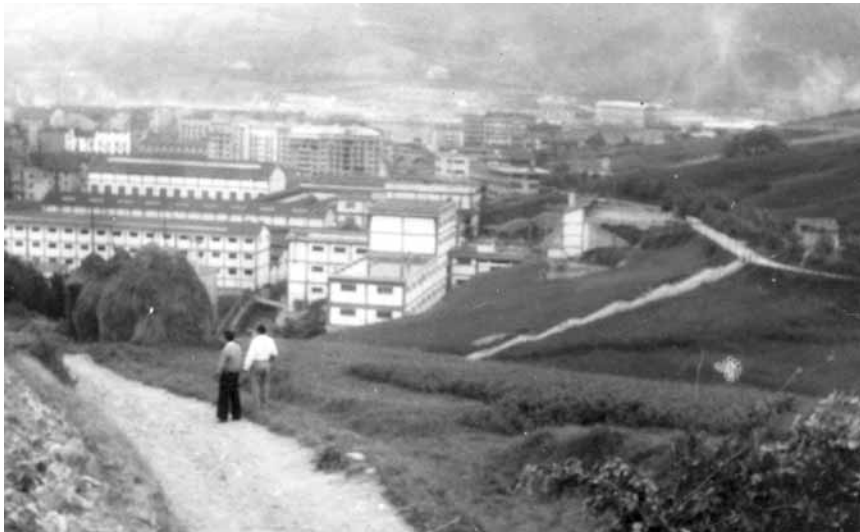
Vista de la factoría Victorio Luzuriaga desde Iparragirre. Hacia 1970.