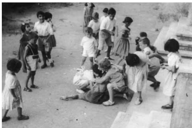
Delante de la casa Ipar-alde, grupo de niños y niñas recogiendo del suelo los dulces y perri-llas que con motivo del bautizo de un recién nacido se solía echar. Hacia 1958.