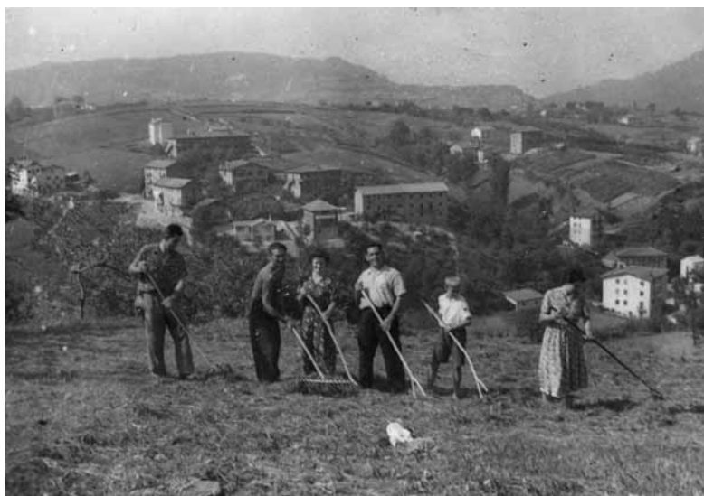
Iparragirrekoak belarretan. Atzean, Molinao Goikoa. 1950. hamarkadan.

Cuando nos ponemos delante de un papel para decir algo de una de las muchas y diferenciadas partes de Altza, nos damos cuenta de que nuestro cariño, respeto y dedicación a nuestro pueblo, no es suficiente. A pesar de nuestro esfuerzo ¡qué desconocido es! A pesar de nuestra curiosidad, de nuestro continuo preguntar, indagar ¡cuánto nos falta! ¿Lo conseguiremos algún día?