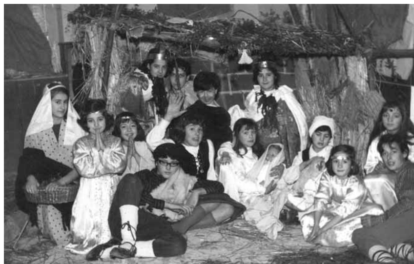
Representación del misterio de la Natividad por alumnas de La Anunciata. Navidad de 1963.