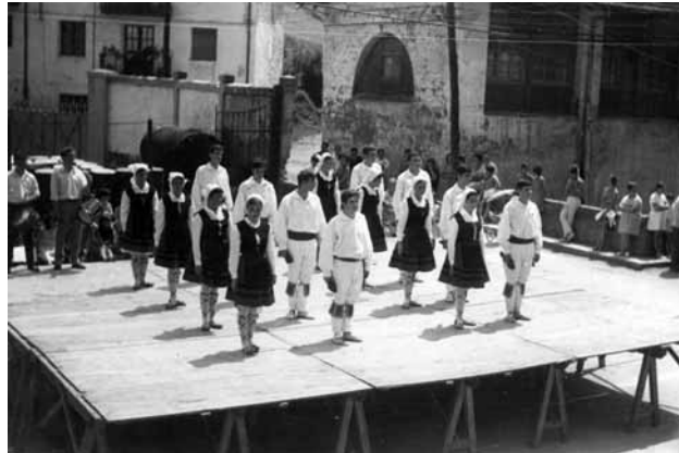
Grupo de Danzas Alkartasuna actuando con motivo de las fiestas del patrono de Molinao, Santo Domingo de Guzmán, el 8 de agosto de 1968.