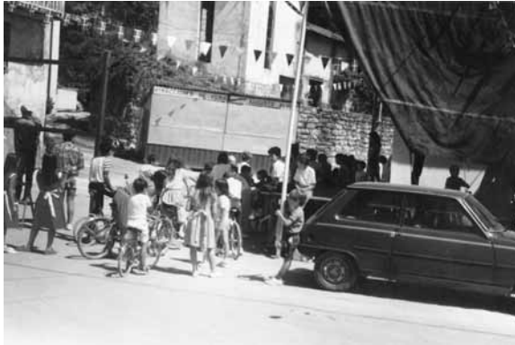
Celebración de las fiestas patronales de Santo Domingo de Guzmán, el 8 de agosto de 1985.